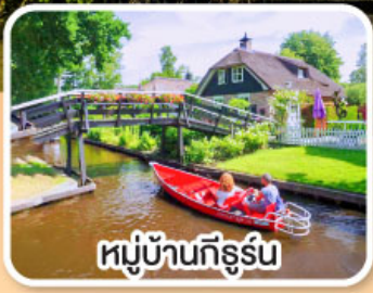
หมู่บ้านทึร์รึน