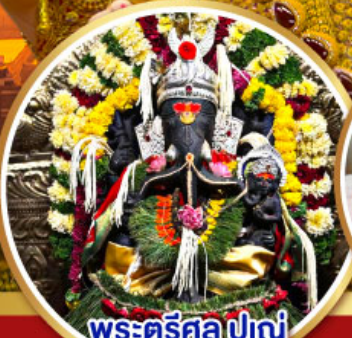
พระตรีศูล ปูणे (Trishul Pune)