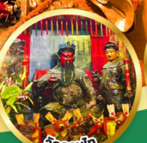
วัดกวนโก