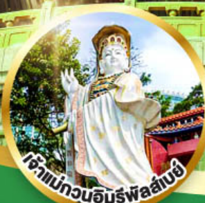
เจ้าแม่กวนอิมรับพลานามัย