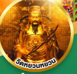
วัดหยวนทวยวน