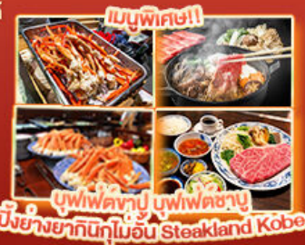
บุฟเฟ่ต์ญี่ปุ่นบุฟเฟ่ต์ญี่ปุ่น ปิ้งย่างยากิnikuในอน Steakland Kobe