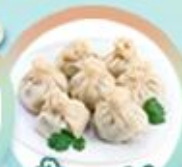
เกี้ยวจอร์เจีย Khinkali