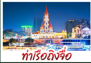
ทำเรือหงโจ้ว

พาเซ็งเซ็งสวนดอกไม้ตามฤดูกาล หมู่บ้านสไตล์ยุโรปเจียงยวี่ มังซัง เสี่ยวเจิน ถนนคนเดิน NANNING ZHIYE - เมืองโบราณไท่ผิง ทำเรือหงโจ้ว - ถนนคนเดิน สามตรอกสองซอย