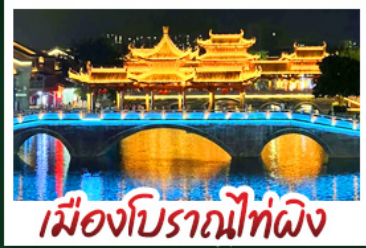
เมืองโบราณไท่ผิง