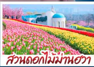
สวนดอกไม้ม้าฮาวา