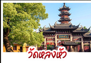
วัดเลงเซวี่