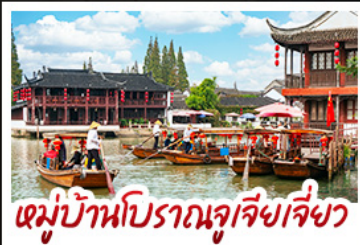
หมู่บ้านโบราณจูเจียเจี๋ย

04 - 08 ธ.ค. 69 24,900 09 - 13 ธ.ค. 69 24,900 17 - 21 ธ.ค. 69 23,900 24 - 28 ธ.ค. 69 26,900 29 ธ.ค. - 02 ม.ค. 70 28,900 30 ธ.ค. - 03 ม.ค. 70 28,900