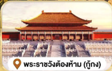
📍 พระราชวังต้องห้าม (กู้กง)