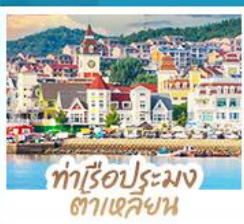
ท่าเรือประมง ต้าเหลียน