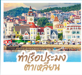
ทำเรือประมง ต้าเหลียน