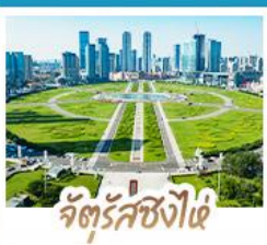
จัตุรัสชิงไฉ่