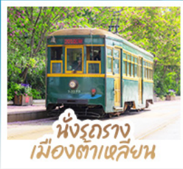
นั่งรถราง เมืองต้าเหลียน