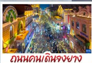
ถนนคนเดินจงยาง