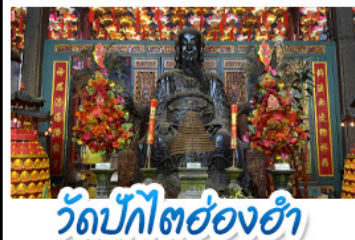
วัดปักไต้ฮ่องกง