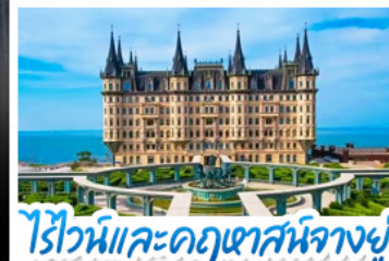
ไรไวน์และคฤหาสน์จางยู