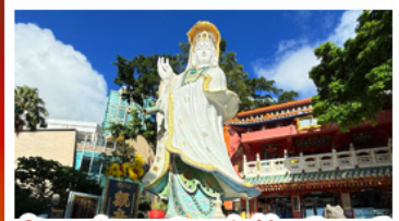
เจ้าแม่กวนอิมรัฟัสเบย์