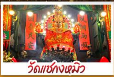
วัดเซกตงเหมียว