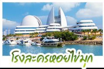
ริ่งละครเซอซำใหม่