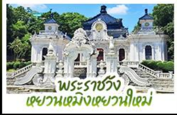
พระราชวัง เซवानเม็งเซวานีเม่