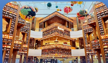
ต๋องสมุดสตาร์ฟิค