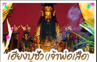
เซียงจูซิว (เจ้าพ่อเสือ)