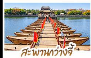
สะพานกว้างจี