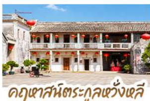
อุทยานวัฒนธรรมกุหลาบแดง

ตามรอยภาพยนตร์สุดซึ้งแห่งปี "จดหมายรักถึงอาม่า" • เยี่ยมเมืองโบราณเต๋จิว ดินแดนต้นกำเนิดชาวจีนโพ้นทะเลที่อพยพสู่ประเทศไทย • เดินเล่นหมู่บ้านโบราณหลงหู สัมผัสบรรยากาศเต๋จิวดั้งเดิมราวกับหลุดเข้าไปในฉากหนึ่ง • ชมย่านเมืองเก่าชิวเถาและ สวนสาธารณะสีเขียวชอุ่ม หนึ่งในสถานที่ที่ได้รับความนิยมจากแฟนภาพยนตร์ ชมจดหมายโบราณอายุกว่าร้อยปี ณ พิพิธภัณฑ์จดหมายชาวจีนโพ้นทะเล