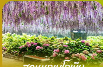
สวนนกเป็ดกึ่ง