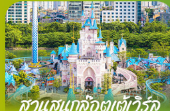
สวนสนุกลิตเติ้ลเวิร์ล Lotte Adventure world