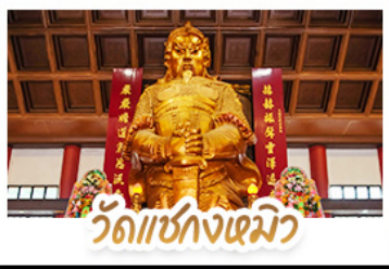
วัดเซ่งกงเมียว