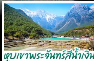
เขุบเขาพระจันทร์สีน้ำเงิน