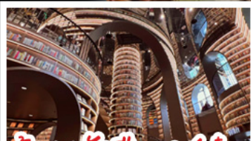
ร้านหนังสือจุงกูเกอ