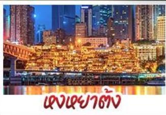
แดงเซาตัง