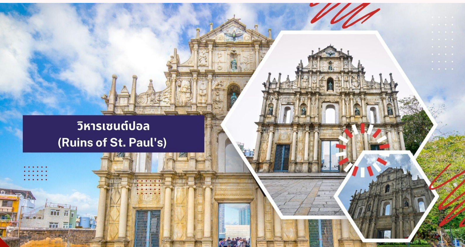
วิหารเซนต์ปอล (Ruins of St. Paul's)

นำท่านเดินทางสู่ นำท่านเดินทางสู่ มาเก๊า (ในการเดินทางข้ามด่าน ท่านจะต้องลากกระเป๋าสัมภาระของท่านเอง และผ่านพิธีการตรวจคนเข้าเมืองใช้เวลาในการเดินประมาณ 45-60 นาที) ในอดีตมาเก๊าเป็นเพียงแค่มุมบ้านเกษตรกรรมและประมงเล็กๆ ซึ่งเป็นเมืองที่มีประวัติศาสตร์ยาวนาน โดยมีชาวจีนกวางตุ้งและฟูเจี้ยนเป็นชนชาติดั้งเดิม จนมาถึงช่วงต้นศตวรรษที่ 16 ชาวโปรตุเกสได้เดินเรือเข้ามายังคาบสมุทรแถบนี้เพื่อติดต่อค้าขายกับชาวจีนและมาสร้างอาณานิคมอยู่ในแถบนี้ ที่สำคัญ คือ ชาวโปรตุเกสได้นำพาเอาความเจริญรุ่งเรืองทางด้านสถาปัตยกรรมและศิลปวัฒนธรรมของชาติตะวันตกเข้ามาอย่างมากมาย ทำให้มาเก๊ากลายเป็นเมืองที่มีการผสมผสานระหว่างวัฒนธรรมตะวันออกและตะวันตกอย่างลงตัว