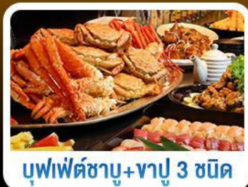
บุฟเฟ่ต์ชาบู+ชาบู 3 ชนิด