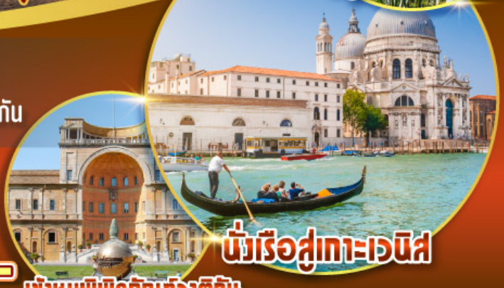
นั่งเรือสู่เกาะเวนิส