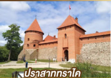
ปราสาททราไค