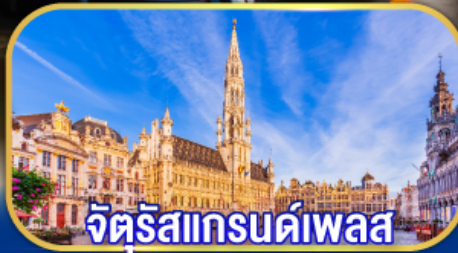
จตุรัสแกรนด์เพลส