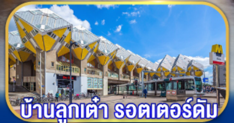
บ้านลูกเต๋า รถเตอร์ดัม

เยือนเมืองเก่าแก่ถูกระคต์ เก็บไฮไลต์กลุ่มประเทศเบเนลักซ์ กับการบินไทย บินตรงอัมสเตอร์ดัม