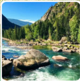
อุทยานเคอเคอทั้วไห่