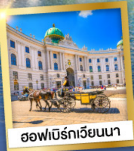
ออฟฟิเบิร์กเวียนนา