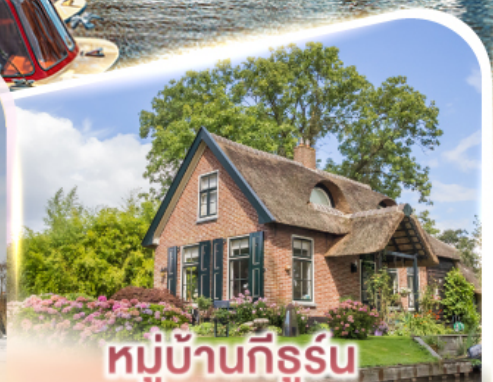
หมู่บ้านทึร์รูน