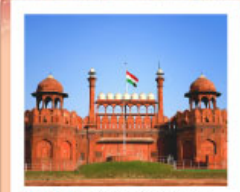
♡♡♡ Agra Fort