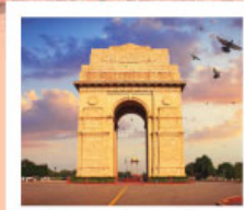
♡♡♡ India Gate