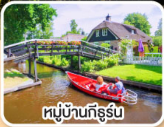
หมู่บ้านทึร์รูน