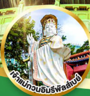
เจ้าแม่กวนอิมทรัพย์สิน