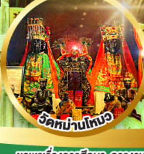
วัดบ้านโทนว

ขอพรเรื่องการศึกษา, การงาน สติปัญญาและความกล้าหาญ