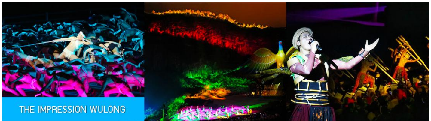
THE IMPRESSION WULONG

OPTIONAL TOUR ไกด์ชายโปรแกรมเสริมบัตรชมการแสดง ชุด ความประทับใจเมืองอู่หลง THE IMPRESSION WULONG หนึ่งในการแสดงที่ดีที่สุดของจีน ที่กำกับโดยผู้กำกับชื่อดัง จางยีโฮมว