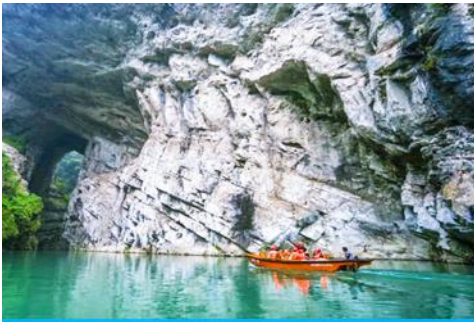
ล่องเรือลำธารใต้ดินผู่วา