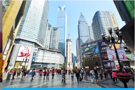
ย่านเจี๋ยฟางเปย