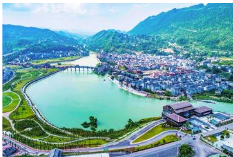
เมืองโบราณจั่วสู่ย

เที่ยง รับประทานอาหารกลางวัน ณ ภัตตาคาร (6)