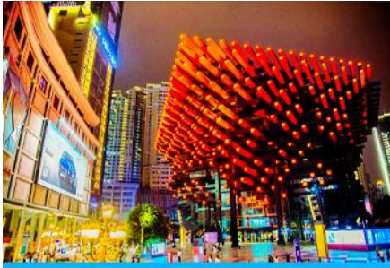
หอศิลป์กั๋วไท่