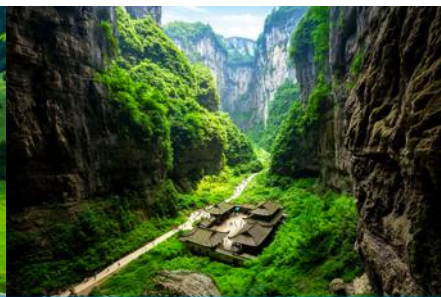
สะพานธรรมชาติสามแห่ง

วันที่สอง เมืองจงชิ่ง-เมืองอู่หลง- อุทยานเขานางฟ้ารวมรถไฟแฟนซี- อุทยานหลุมฟ้ารวมลิฟท์แก้ว – สะพานธรรมชาติสามแห่ง- OPTIONAL TOUR ชุดการแสดง THE IMPRESSION OF WULONG