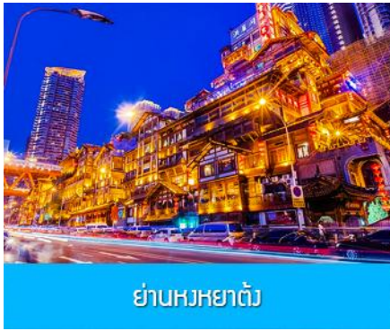
ย่านหงหยาดัว