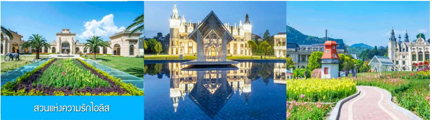
สวนแห่งความรักไอลิส