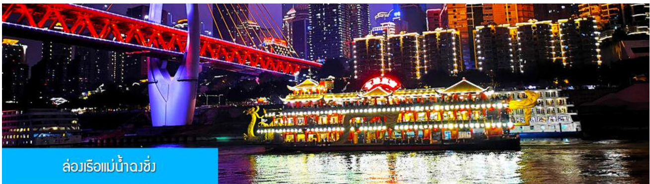
ล่องเรือแม่น้ำจางชิ่ง

OPTIONAL TOUR ไกด์ชายโปรแกรมเสริมล่องเรือชมความสวยงามของสองริมฝั่งแม่น้ำเมืองจงชิ่ง เมืองที่มีสมญานามว่ามีวิวยามค่ำที่สวยงามที่สุดแห่งหนึ่งของจีน รวมอาหารมื้อเย็น (สุกั๋หม่าล่าต้นตำหรับจงชิ่ง)