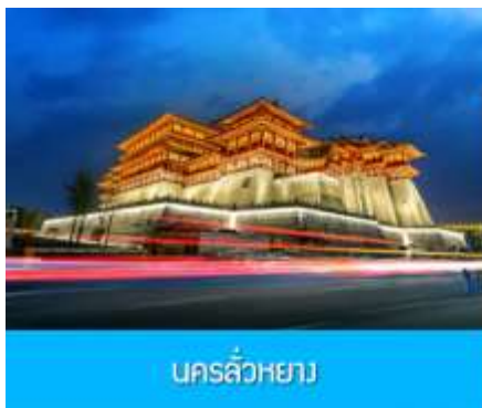
นครฉว๋หยาง