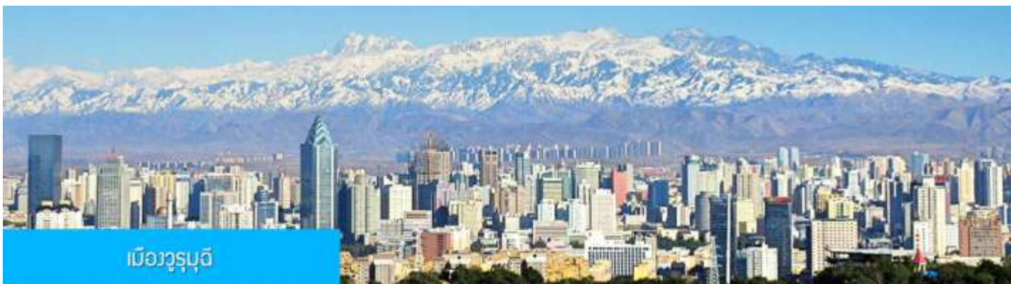
เมืองวูรูมูฉี