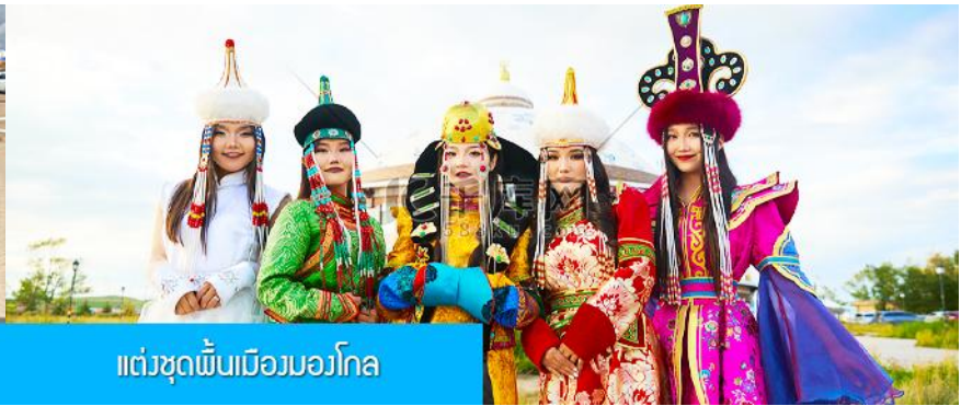
แต่งชุดพื้นเมืองมองโกล