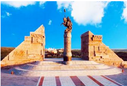
อุทยานก่อกองเจงกิสข่าน