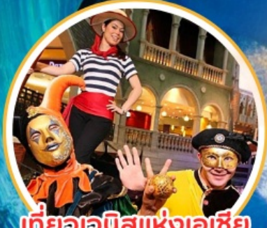
เที่ยวเอเชียแห่งเอเชีย