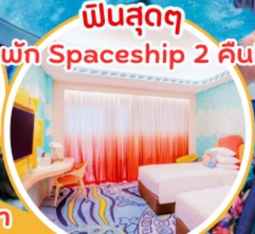
ฟินสุดๆ พัก Spaceship 2 คืน!!