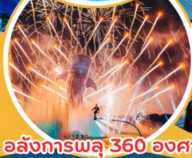
อลังการพลุ 360 องศา