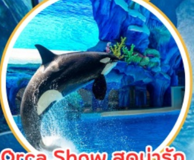
Orca Show สุดน่ารัก