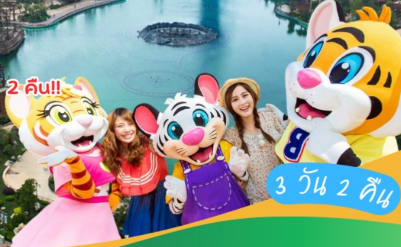
3 วัน 2 คืน