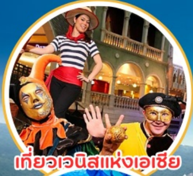
เที่ยวเอเชียแห่งเอเชีย

🏠 58/56 หมู่บ้านเดอะเบเกอรี่ ซ.กำนันแม้น 3 ถนนเอกชัย เขตบางบอน กรุงเทพฯ 10150 ☎ 02-896 1001-2 / 02-897 7244-5 ✉ funnytripholidays@gmail.com 🌐 www.funnytripholiday.com 📞 @funnytrip