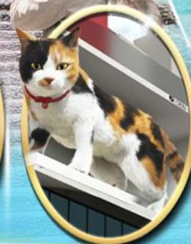
ซอยบิจิ ซินจุกุ