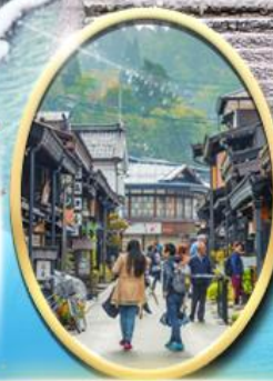
เมืองเก่า ทาคายาม่า