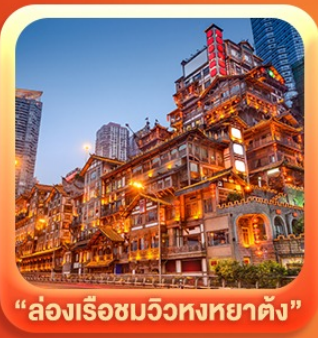
“ล่องเรือชมวิวหงหยาดัง”