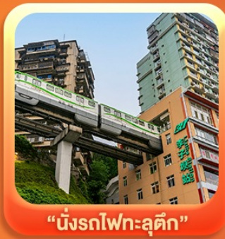
“นั่งรถไฟทะลุตึก”