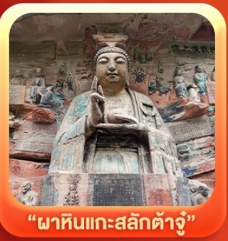
“ผาหินแกะสลักต้าจู้”