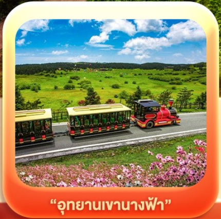
“อุทยานเขานางฟ้า”

บินตรงลงชิง • อุ่หลง หลุมฟ้าสะพานสวรรค์ • ระเบียบแก้ว • อุทยานเขานางฟ้า หงหยาดัง • นั่งรถไฟทะลุตึก • ล่องเรือชมดวงชิงยามค่ำคืน • ศาลาประชาคม (ด้านนอก) มรดกโลกผาหินแกะสลักต้าจู้ • เมืองโบราณซือปาที • วัดหลิวฮั่น • ตึกตะเกียบ