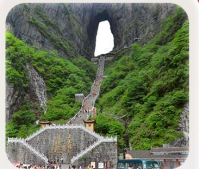
“กำแพงประตูสวรรค์”