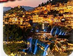
“เมืองโบราณฟู่หลงเจิ้น”