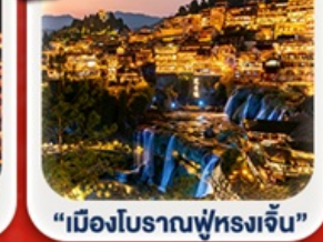
“เมืองโบราณฟู่หลงเจิ้น”