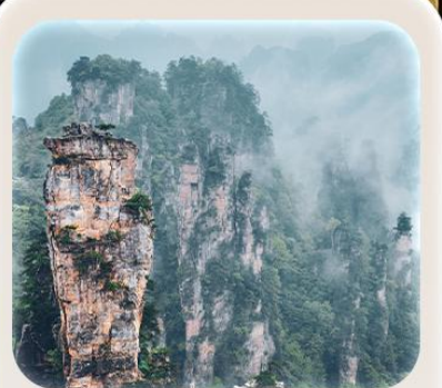
“หุบเขาอวตาร”