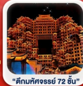
“ตึกมหัศจรรย์ 72 ชั้น”