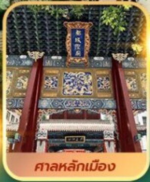
ศาลหลักเมือง