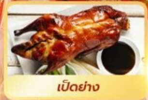
เป็ดย่าง