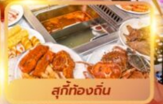
สุกี้ท้องถิ่น