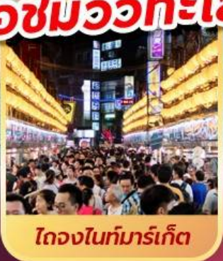
ตองไนท์มาร์เก็ต