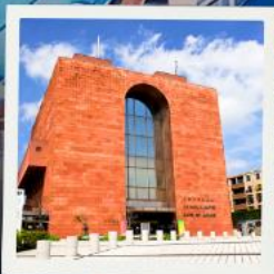
Nagasaki Atomic Bomb Museum