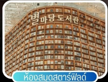
ห้องสมุดสตาร์ฟิลด์