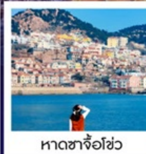
หาดซาจื่อฮั่ว