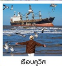
เรือลิวอิส