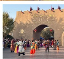
เมืองโบราณคัชการ์