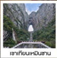
เขาคิยงเหินชาน

พิเศษ!!...รอบค่ำเช้าชุดพื้นเมืองที่ฟ่งหวง • รอบค่ำช่างถ่ายรูป น้ำตกฟูหรง