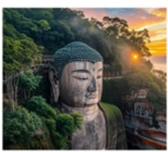
หลวงพ่อโตเล่อซาน