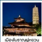
เมืองโบราณฝูหยวน