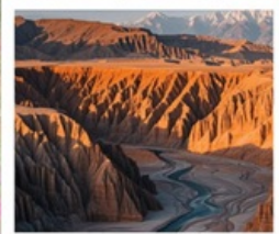
แกรนด์แคนยอนตู้ซานจื่อ